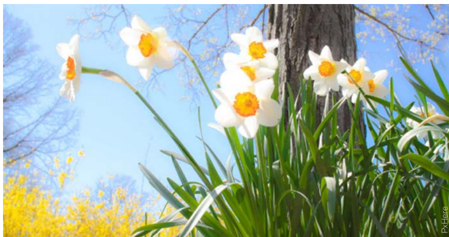
Die Sonne scheint auf zum Osterfest aufblühende Narzissen: Hoffen, leben, lieben!

Was wird noch kommen? Das war die Eingangsfrage – und zu Ostern haben wir eine Antwort: Gott ist stärker als alle Macht dieser Welt, Gott ist stärker als der Tod – aber es geht wohl nicht ohne uns!