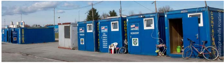
Container-Lager in Sisak