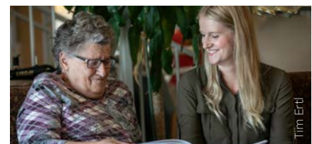
Besuchsdienst im Caritas Pflegewohnhaus Lannach