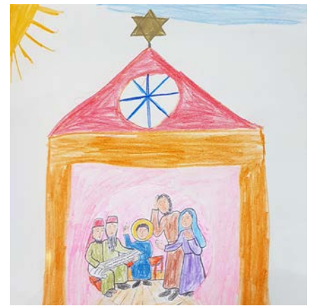
So stellt sich eine Erstklasslerin den Tempel zur Zeit Jesu vor.

Immer wieder bekam ich schöne Rückmeldungen von Kindern und El-